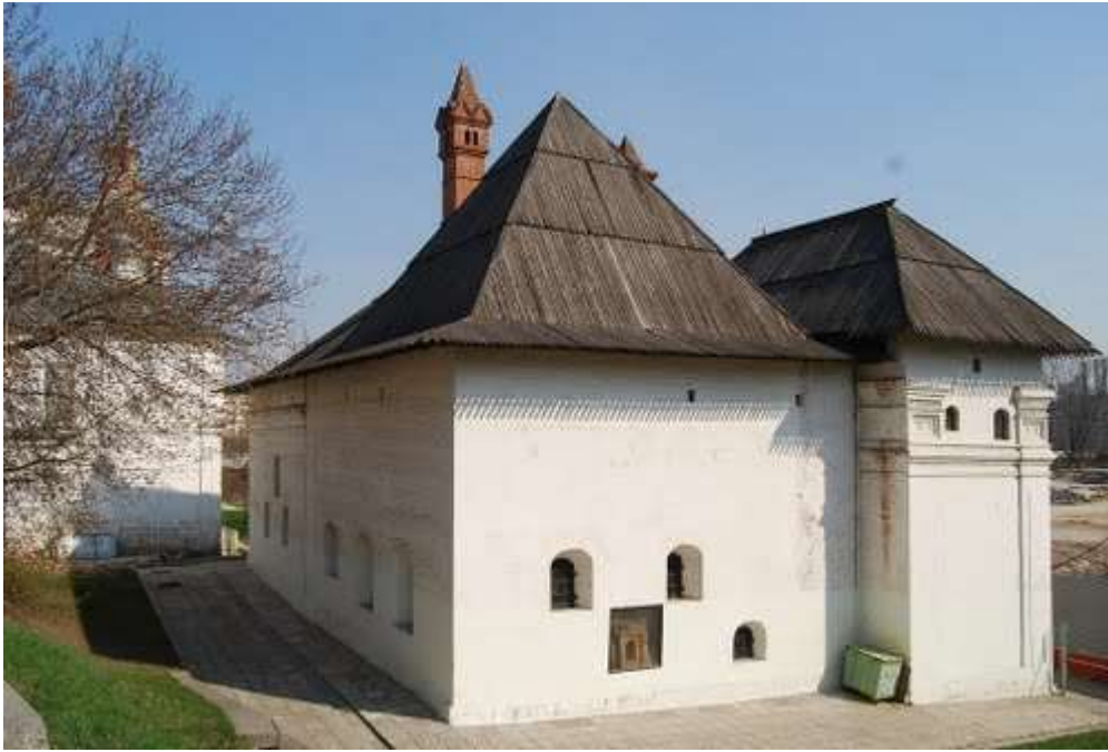
Одна из первых цифирных школ

• В религиозной сфере император тоже успел много чего изменить. В 1721 году он упразднил патриаршество ( патриарха не избирали с 1700 года ) и заменил его Синодом - государственным органом церковного управления . Теперь всеми делами Церкви заведовал светский чиновник - обер-прокурор , а ее главой был сам император. Кроме того, Петр разрешил иностранцам открыто исповедовать свою веру, а также вступать как лицам разных конфессий.