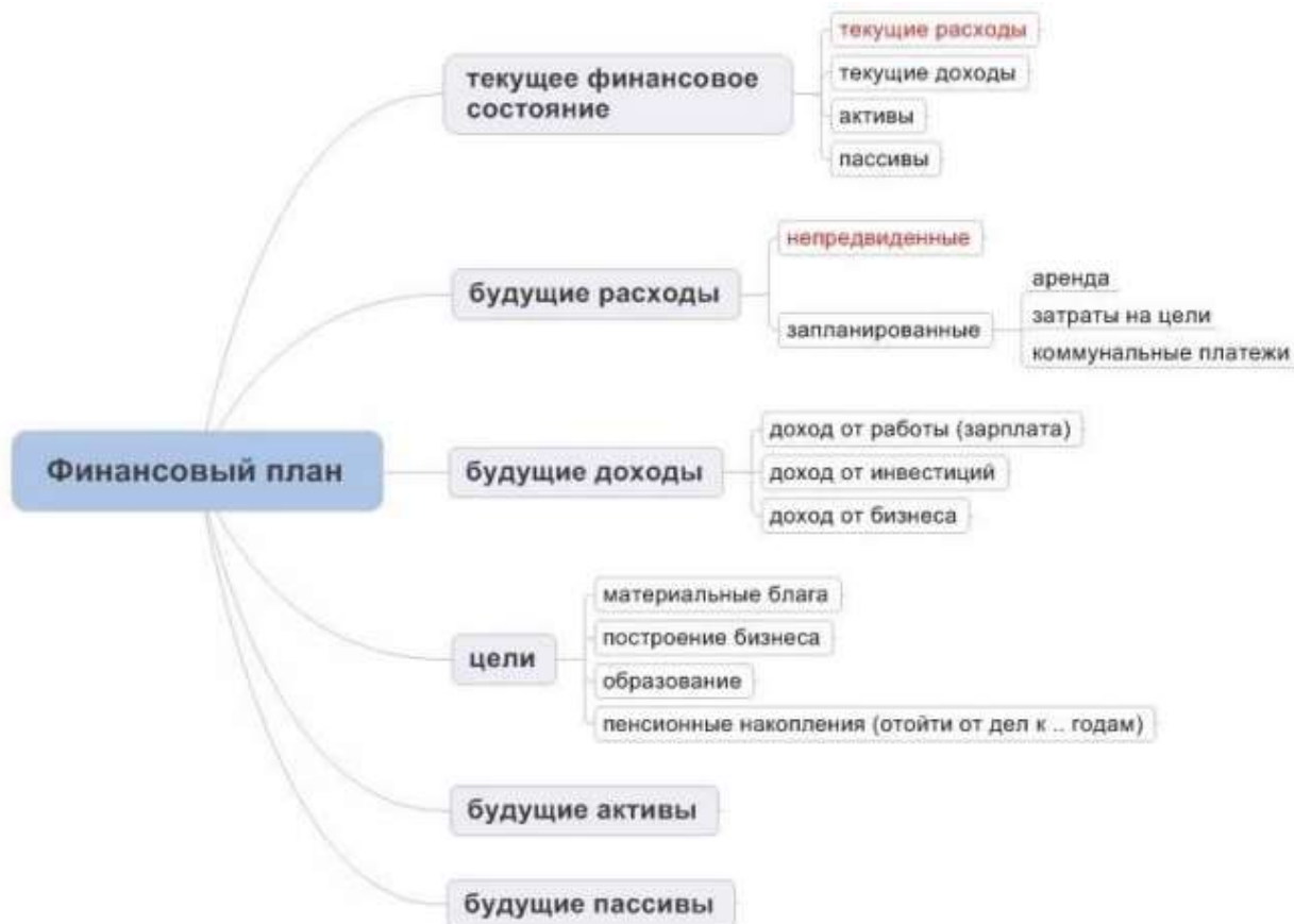
Рисунок 2 - Структура финансового плана

Этапы построения личного финансового плана (рис.3):