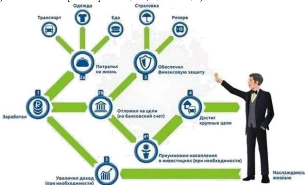
Рисунок 3 – Построение личного финансового плана

3) Заставить свои сбережения работать (вклады, инвестиции)