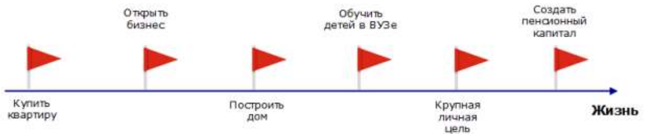
Рисунок 1 – Пример крупных финансовых задач семьи

Личный финансовый план: финансовые цели, стратегия и способы их достижения. Личный финансовый план - план достижения ваших личных финансовых целей. По мере взросления человек понимает, что перед ним в жизни стоят важные финансовые задачи. Например, они могут выглядеть следующим образом (рис.1):